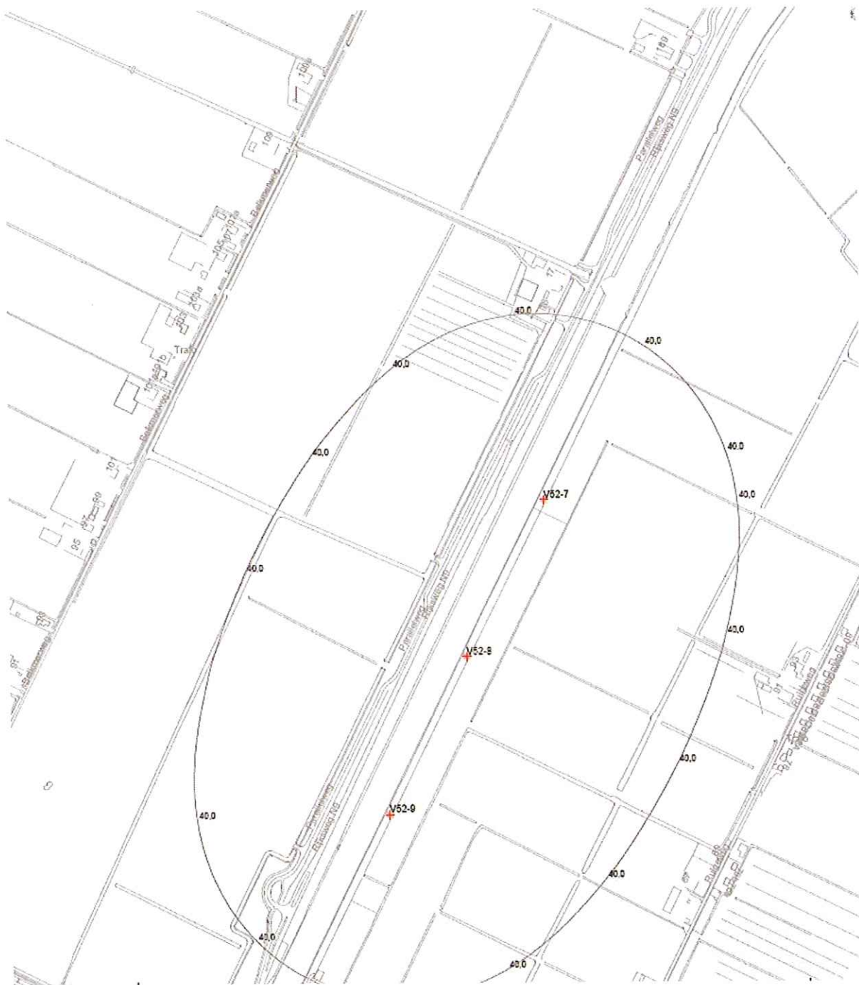
Ten noorden van Sint Maartensvlotbrug