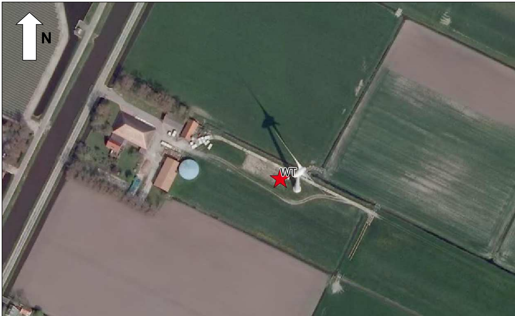
Locatie nieuwe windturbine Enercon type E70 (nabij de huidige turbine, welke wordt geamoveerd)